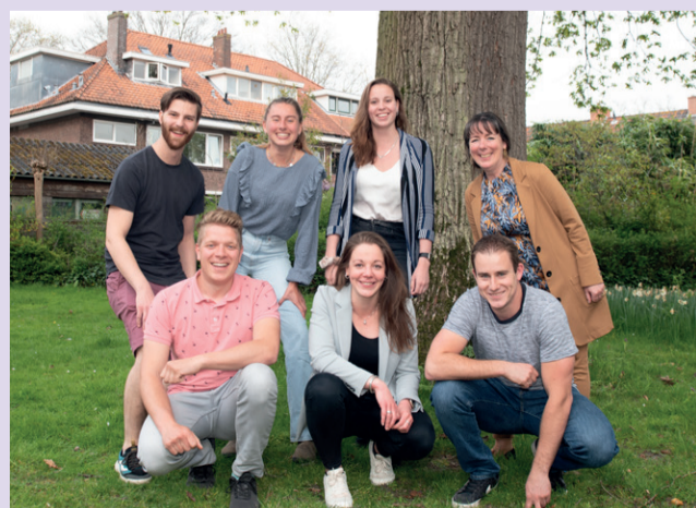
Werkgroep, foto René de Wit

Het is lastig om de juiste vrijwilligers te vinden als organisatie. Houd vooraf in gedachten dat er twee soorten vrijwilligers zijn: Vrijwilligers die soms vrijwilligerswerk willen doen en vrijwilligers die juist op vaste tijden vrijwilligerswerk willen doen. Om vrijwilligers te vinden is aanmelding